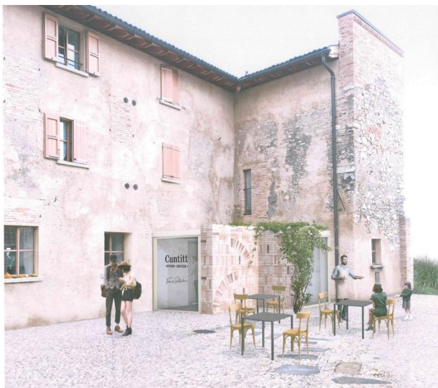
Bussola ingresso Osteria Cuntitt

Oltre a ciò verranno eseguite anche delle migliorie nello spazio dedicato alla sala del ristorante, in particolare modo per sistemare il problema dell'acustica, l'architetto ha previsto un soffitto fonoassorbente. Infine l'attuale bancone presente nella sala, sarà ridimensionato permettendo l'aumento di un paio di tavoli.