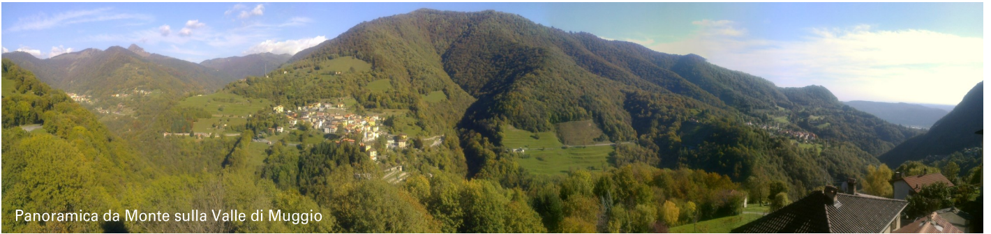
Panoramica da Monte sulla Valle di Muggio